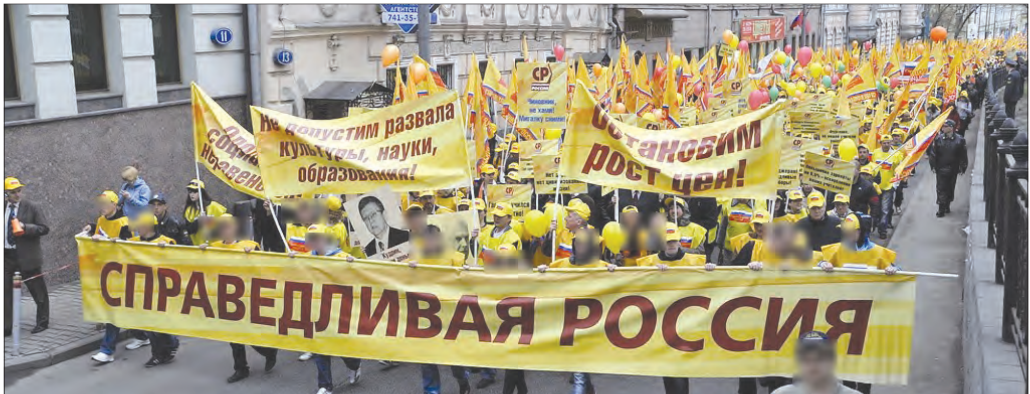
Положения программы партии СПРАВЕДЛИВАЯ РОССИЯ будут реализованы не иначе чем на основании федеральных законов в целях достижения социальной справедливости

ДА - РАЗВИТИЮ РАБОЧЕГО ДВИЖЕНИЯ РОССИИ! НЕТ - РЕПРЕССИЯМ ПРОТИВ РАБОЧИХ АКТИВИСТОВ!