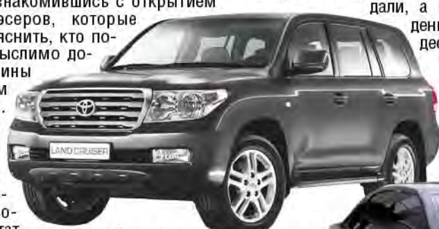
Реанимобиль по версии администрации Свердловской областной клинической больницы

– Я ехал на своем автомобиле по левому ряду и немного наехал на разделительную полосу, – говорит Гудков. – Тут же ко мне подъехали полицейские на патрульной машине. Забрали права, удостоверение депутата Госдумы и попросили проехать за ними. Последовал за ними по резервной полосе. Самое смешное, что именно поездку за полицейскими (по их же просьбе!) мне инкриминировали как нарушение разметки. И больше ничего! Зато по всем телеканалам срочно показали сюжет о том, какой депутат Гудков – злостный нарушитель и дебошир. Причем на моем автомобиле нет никаких спецсигналов, мигалок и т.д. От обычного автомобиля отличается только номерами Госдумы и пропуском на парковку. Уверен, что такие нападки – это «отрыжка системы», своеобразная мсть чиновников. На мой взгляд, они грязно оклеветали меня за то, что опубликовал сведения об их роскошных служебных машинах. Меня это никак не испугало. Напротив, сейчас я собираю документы о недвижимости наших чиновников и их семей. Это будет еще интереснее, чем расследование по машинам.