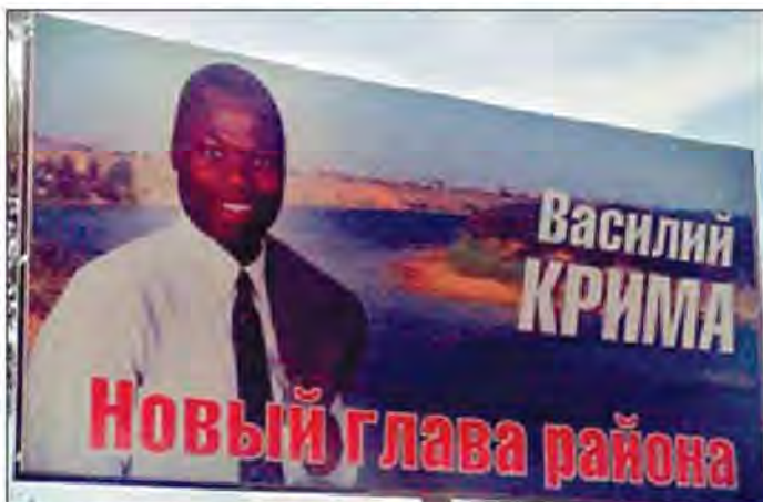
Крима баллотировался на пост главы Среднеахтубинского района со слоганом: «Буду пахать как негр!»