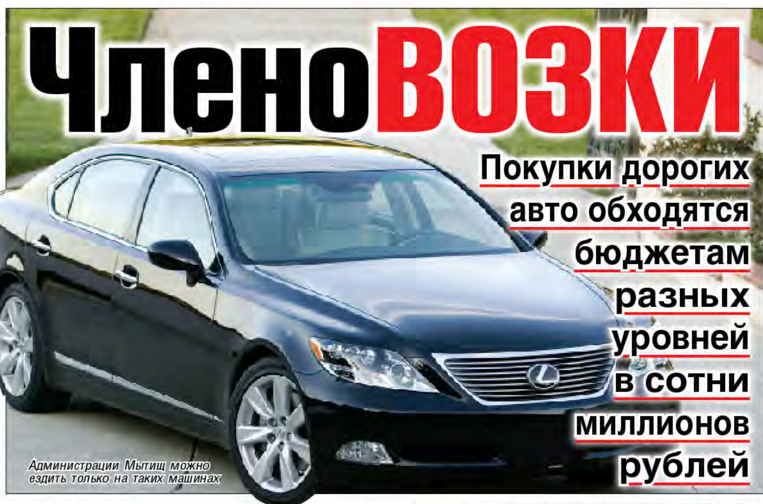
Администрации Мытищ можно ездить только на таких машинах

Войсковая часть №54799 не сильно отстает, у нее – 24 автомобиля Мерседес Бенц 350 (общая стоимость 121 млн. 107 тыс. руб.) А нам по телевизору говорят о поступлении в части новых танков и ракетных комплексов. Это вчерашний день. Современная рос-