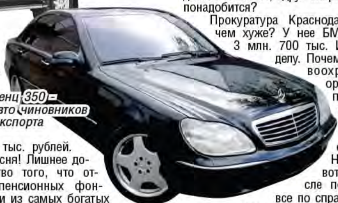
Мерседес Бенц 350 – любимый авто чиновников Рособоронэкспорта

млн. 486 тыс. рублей. Просто песня! Лишнее доказательство того, что отделения пенсионных фондов – одни из самых богатых структур в России. Только пенсионерам не говорите – не поверят все равно.