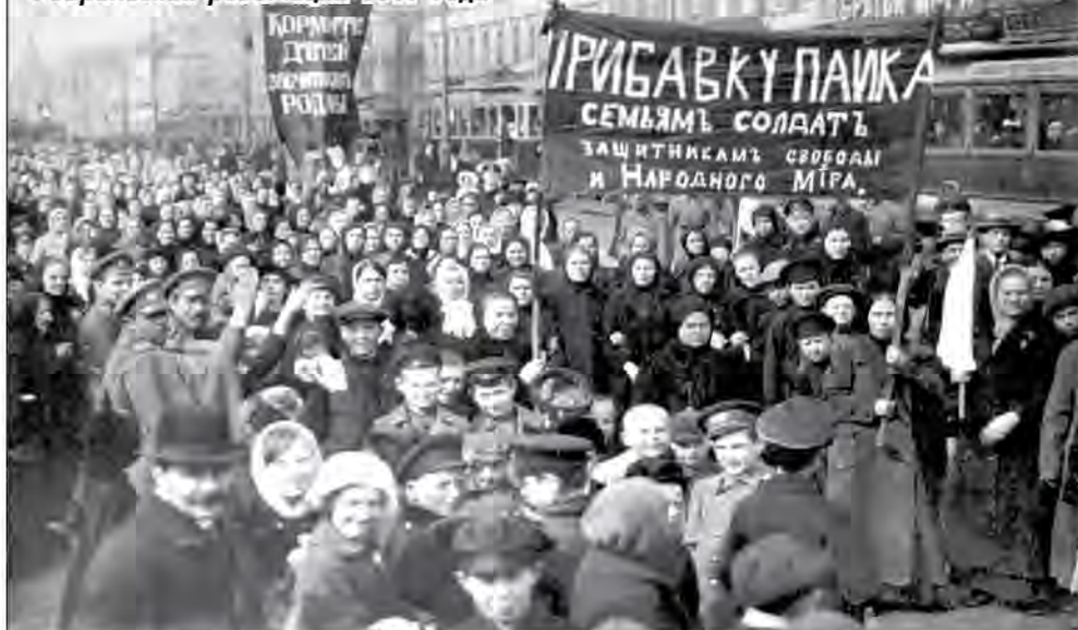
Демонстрация работниц Путиловского завода в первый день Февральской революции 1917 года

Организационное возрождение партии началось уже в ходе революции. Партийные ячейки составлялись, как правило, из немногих, пребывавших до этого в подполье или возвращавшихся в партию бывших эсеров, покинувших ее в межреволюционный период. Возвращались из ссылки и эмиграции лидеры партии. Организационная работа велась в быстром темпе. 2 марта состоялась I Петроградская конференция