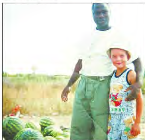
Выращивать арбузы помогает сын Ритиню