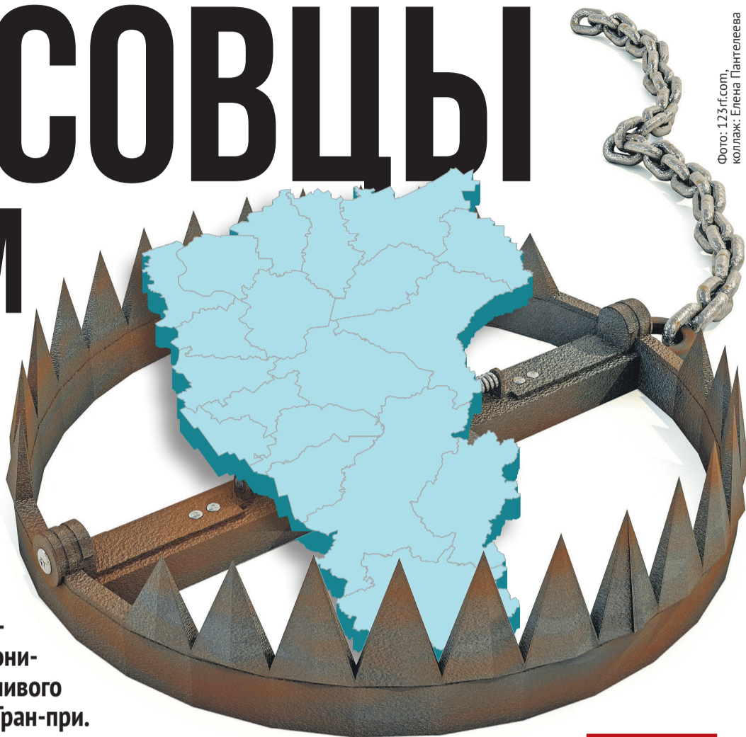
Фото: 123rf.com, коллаж: Елена Пантелеева